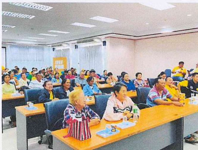
ฟังบรรยาย หลักสูตร การพัฒนาศักยภาพด้านการบริหารจัดการชุมชน พร้อมทัศนศึกษาดูงาน ชักซ้อมกำหนดการเดินทางไปศึกษาดูงาน และชักซ้อมแผน เผชิญเหตุ กรณีมีเหตุฉุกเฉินและจำเป็น